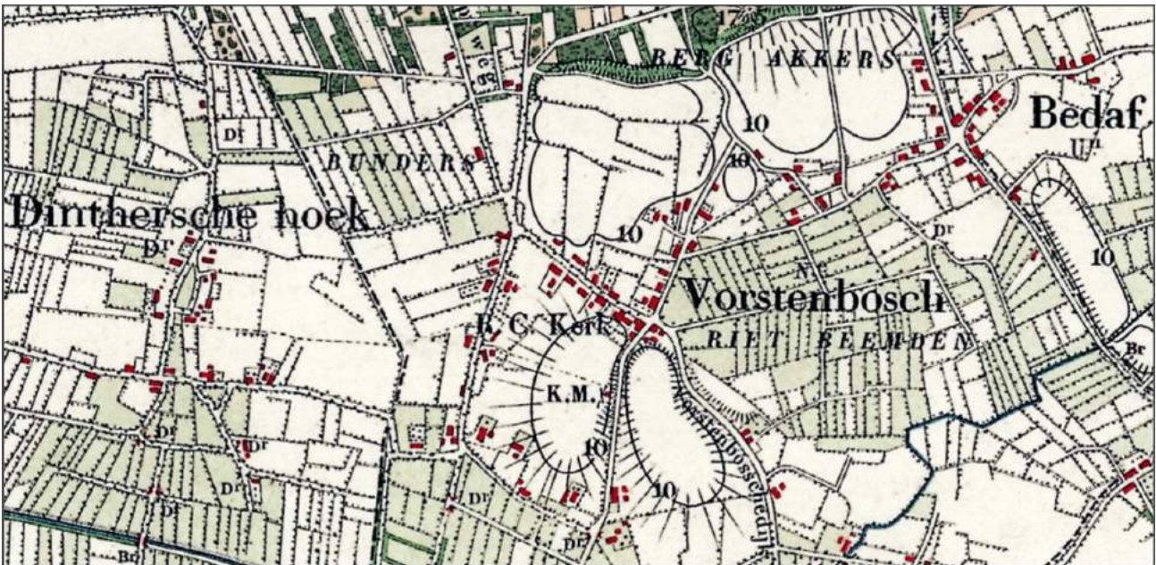
Kaart van Vorstenbosch ca 1920

Het jaar 2020 is net begonnen. We kijken nu eens aan het begin van het jaar terug. Niet op het lopend of voorbijge jaar, maar op 100 jaar geleden, het jaar 1920. Wat was toen het nieuws in Vorstenbosch.