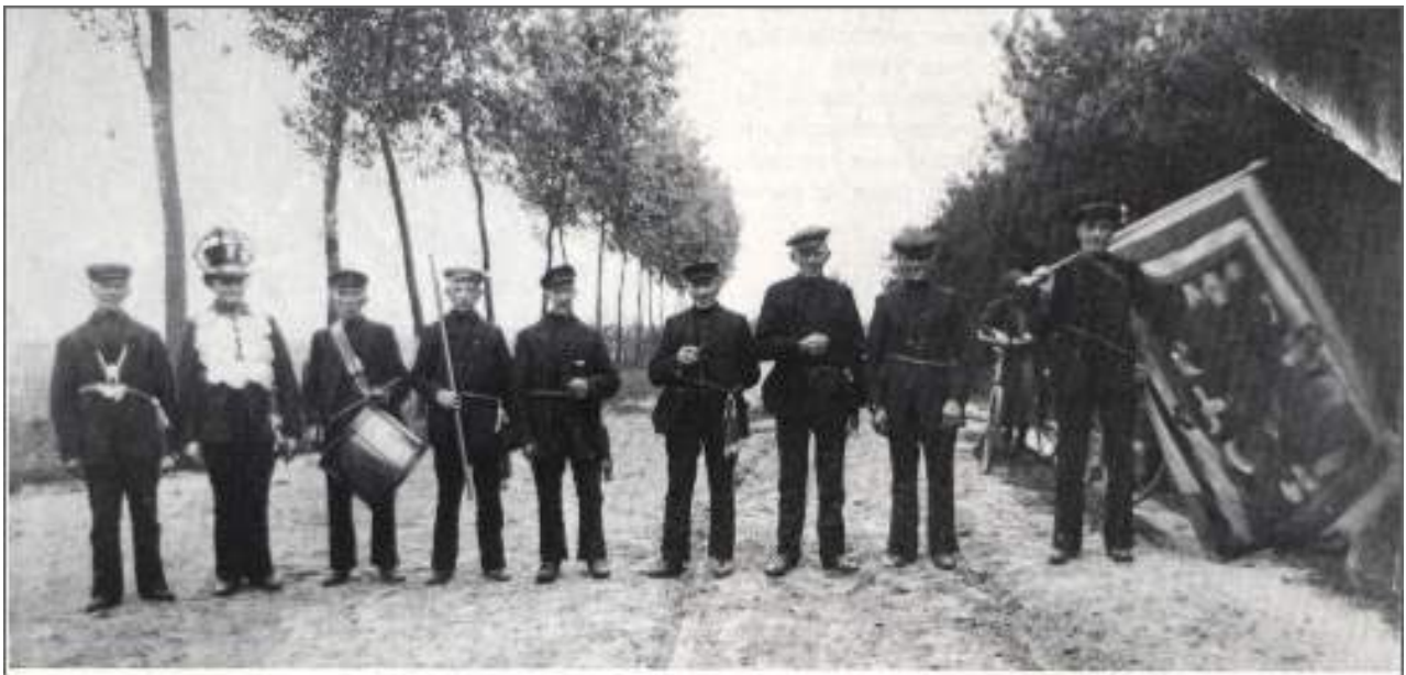
gilde Sint Antonius Abt ca 1927