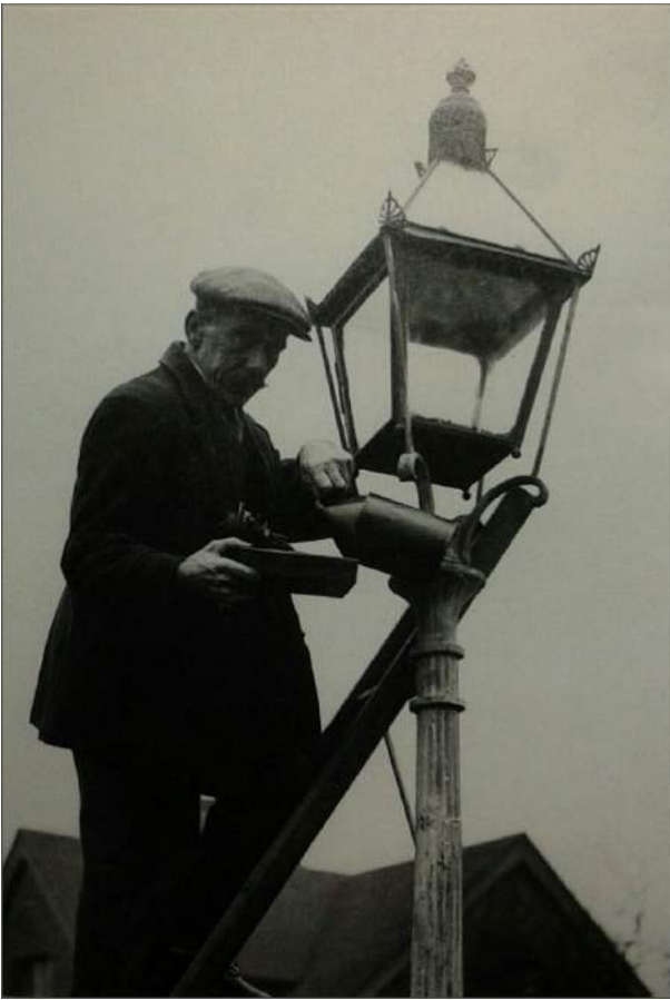
Een lampopsteker aan het begin van de 20ste eeuw

Dan komt oktober en brengt de kermis, de dagen, waarop voor het eerst in het naderend bar seizoen licht in onze dorpsduisternis moet worden gebracht. Met hoeveel zorg heeft de kuster dan dagen te voren reeds kleine verlichtingsproeven genomen. Wel vijfmaal per dag is hij bij de lantaarns geklommen, heeft elk deurtje, elk glas, elke arm tien keer beproefd en eindelijk alles goed bevonden. Nu is het plechtig ogenblik daar, waarop de lantaarns zullen worden ontstoken. Nog eens gekeken of het wel donker genoeg is en het ontsteken van de lampen geen verkwisting van kostelijke gemeenteolie zou zijn? Neen, het is donker genoeg; dan met van aandoening bevende hand de ladder op de schouders genomen en naar het „skolhous" ( schoolhuis = het huis van het hoofd der school, de bovenmeester ) waar de eerste lantaarn hangt en geen heidense priester ontstak ooit met meer eerbied het heilig vuur, als onze kuster de lantaarn, welke geroepen is een feestelijke schijn te werpen over het kleine kermisterrein.