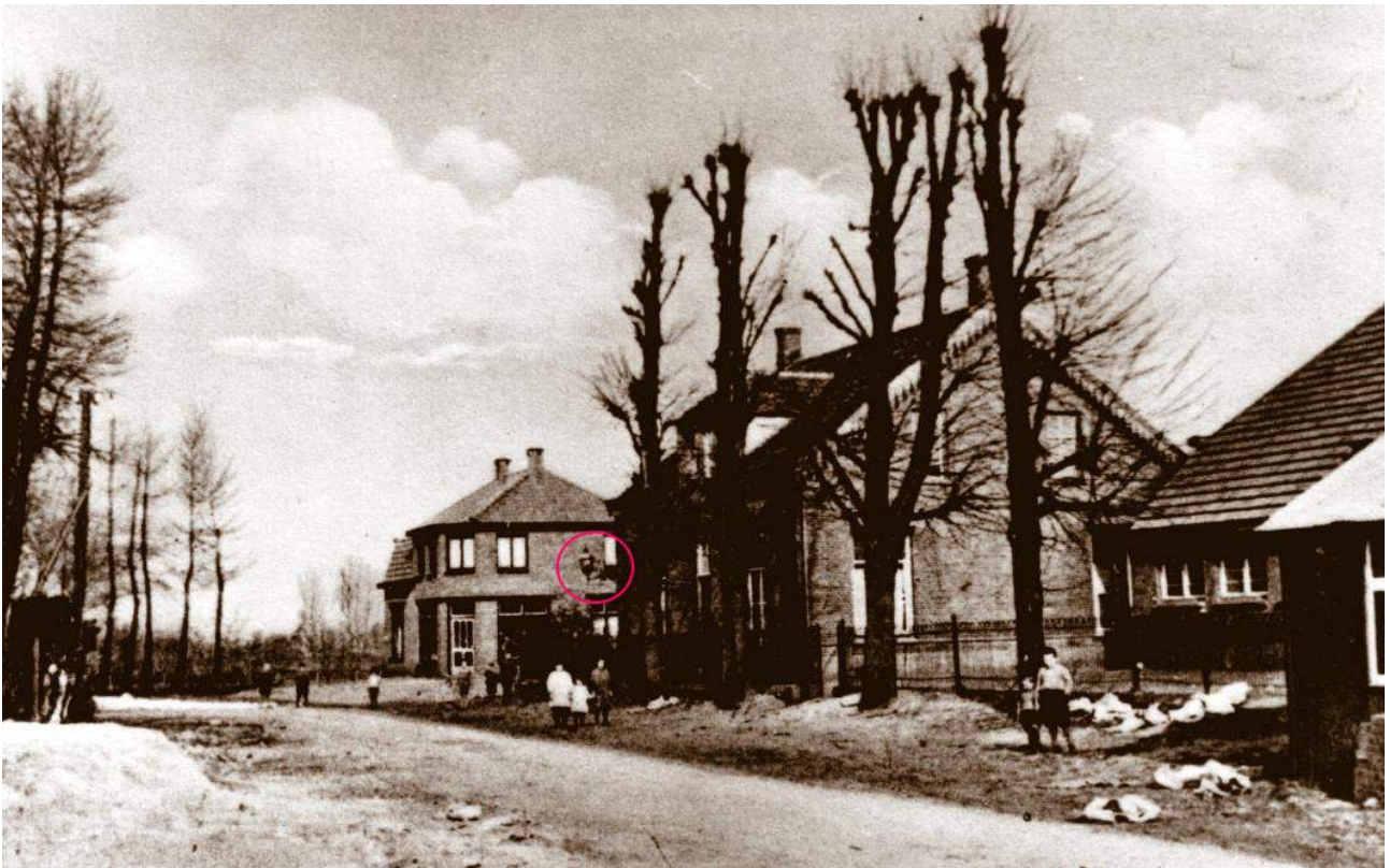
Oude Ansichtkaart van het „schoolhous“ op het huidige Meester Loeffenplein met zichtbaar de lantaarn (omcirkeld). Herkenbaar zijn nog de oude lindebomen en het huis Heuvel 2 van Geenen Diervoeders.

De andere lamp ondergaat eenzelfde bewerking; dan gaat de kuster een pas of tien achteruit om zich te verlustigen in z'n werk en in stille verrukking de rooden schijn gade te slaan, keert nog eens weer, draait de lamp nog wat hoger, dan nog eens gekeken en weer wat lager gedraaid, omdat ze met „zo'n hollen weind zoo licht blaókt, wonne,“ en de kuster gaat zelfvoldaan naar huis. Maar nog wel twintig keer loopt hij naar buiten om te zien of alles in orde is en hij is pas gerust, wanneer hij klokslag tien uur met dezelfde plechtigheid, waarmee straks het ontsteken gepaard ging, de lampen heeft uitgedaan. Zie je nu, dat onze gemeenteverlichting in goede handen is en begrijpt je nu ook, dat de kuster een beslag dreigde te krijgen van schrik, toen verleden winter de lantèèrn on 't skolhous met lamp en al in brand vloog.