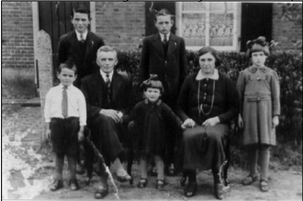
Vorstenbosch, 78 jaar oud.