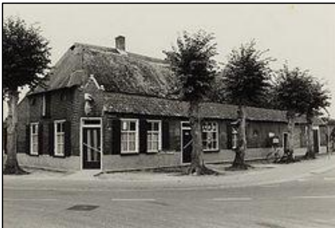
Tekst en foto's: Cor Ottenheim. Foto's: Jo van de Berg en BHIC.

Na 1884 is de woning niet meer bewoond en als schuur ingericht en toegevoegd aan Lendersgat 1 (E761).