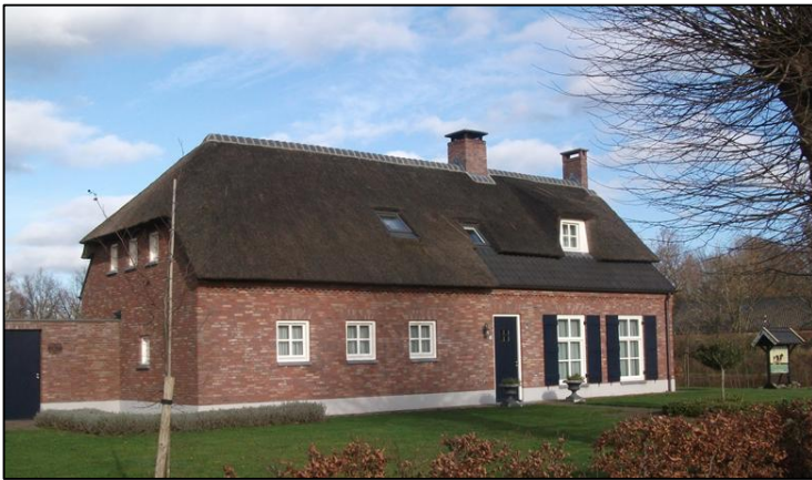
Tekst en foto's: Cor Ottenheim. Foto's: Jo van de Berg en BHIC.