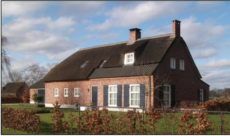
Huidige situatie (2013)